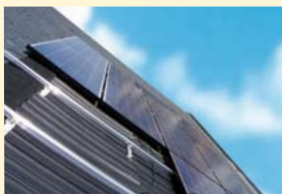
IR 40 - page 14