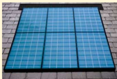
IPV 30 - page 9