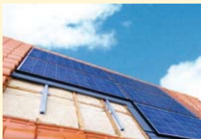
IPV 30 UNI - page 13